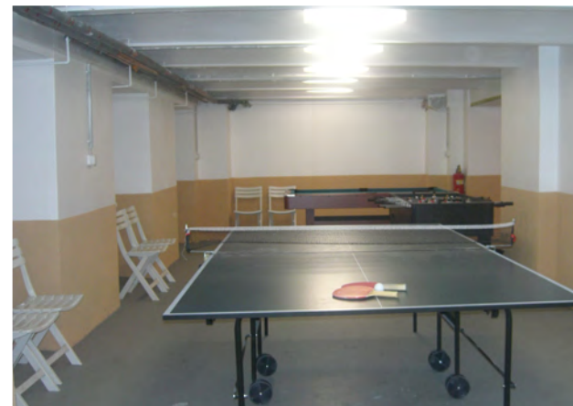
Prostor za sportske aktivnosti