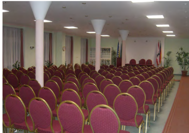
Sala za predavanja